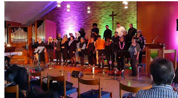
Ansingen vor dem Auftritt

Mache dich auf, werde licht; denn dein Licht kommt, und die Herrlichkeit des HERRN geht auf über dir! «